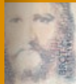
Im Zentrum der Bibel steht die Geschichte Gottes mit den Menschen. Entdecken Sie, wie mit Gottes Offenbarung in Jesus Christus die Geschichte der Christen und der Kirche beginnt.