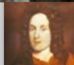
Carl Hildebrand Freiherr von Canstein gründete 1710 die älteste Bibelanstalt der Welt und sorgte dafür, dass die Bibel für viele Menschen bezahlbar wurde.