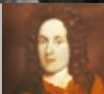
Carl Hildebrand Freiherr von Canstein gründete 1710 die älteste Bibelanstalt der Welt und sorgte dafür, dass die Bibel für viele Menschen bezahlbar wurde.

Immer geht es um Beziehungen: Von Gott zu Mensch und von Mensch zu Mensch.